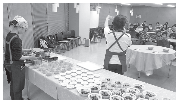
地域の児童及び保護者へのミニ講義