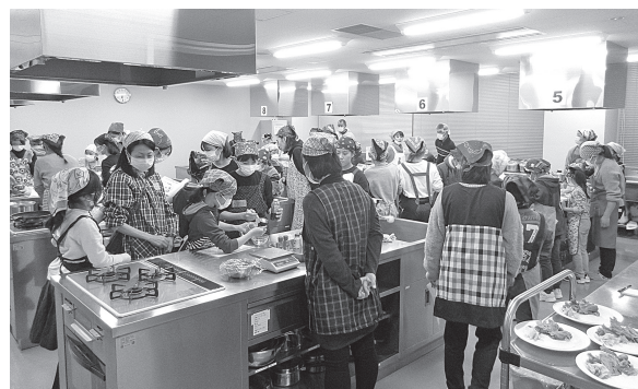
地域の児童及び保護者の調理実習

上記の1)及び2)は、学科教員の協力だけでなく、学生を交えて、企画から実施まで一連の栄養サポートを学ぶ、教育的な場としても活用した。また、得られた調査結果は、現在、分析中である。