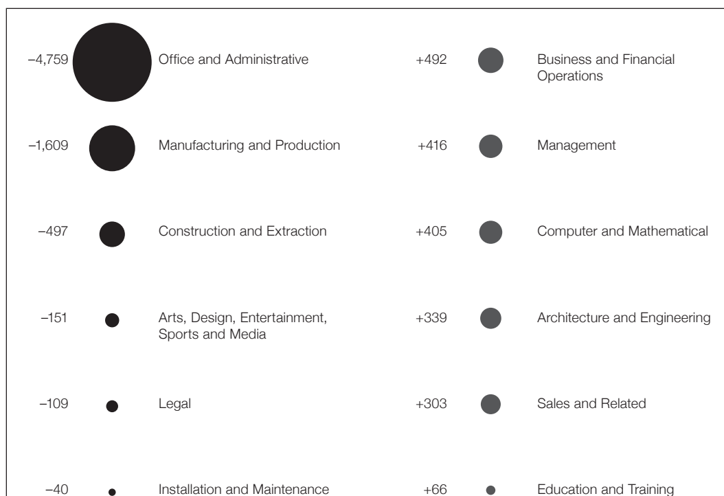
図3. 雇用展望 (2015-2020)

本稿は平成29（2017）年度松本大学学術研究費（萌芽研究）の助成を受けて遂行した研究成果の一部を取りまとめたものである。ここに記し、感謝の意を表す。